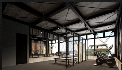
トレーニングジム

地域の経営者に向けて特別な空間を提供し、事務所として、会議スペースとして使用していただきます。さらには、快適に過ごすよう、様々な空間を備えております。