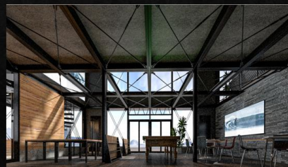
ミーティングルーム