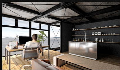
プライベートルーム